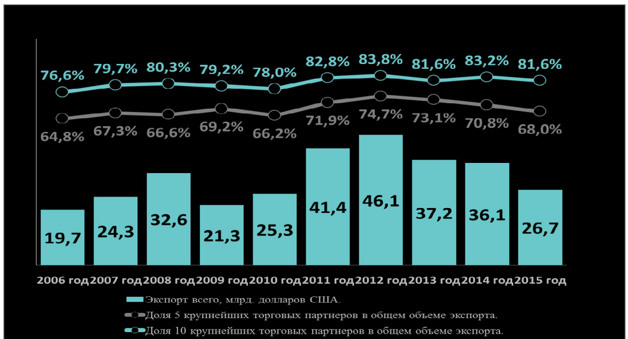
Рис. 1. Географическое распределение экспорта в 2006 – 2015 годах

Экспорт в первую пятерку стран в 2015 году составил 68 процентов от всего экспорта (Россия – 38,9 процента, Украина – 9,4 процента, Великобритания – 11,2 процента, Нидерланды – 4,3 процента, Германия – 4,1 процента), в то время как в 2010 году этот показатель составлял 66,2 процента.